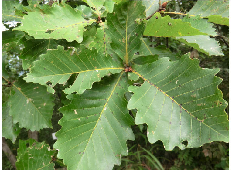
フモトミズナラの葉